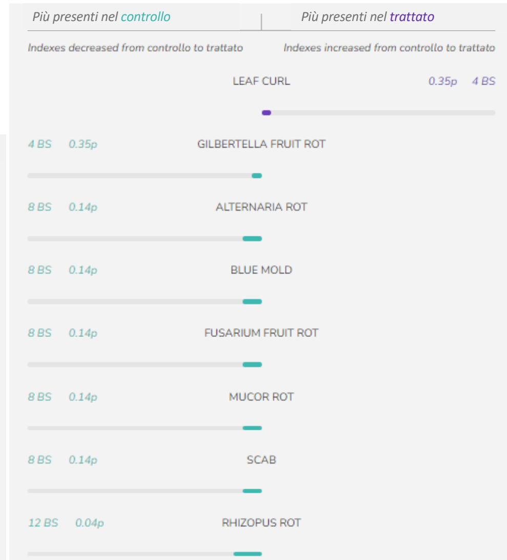
Figura3: abbondanza relativa di microrganismi agenti di malattie, nel confronto tra campioni da suoli trattati e non con inoculi microbici. Modificato da report analitico BECROP By Biome Makers